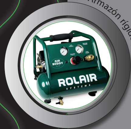
Armazón rígido protector