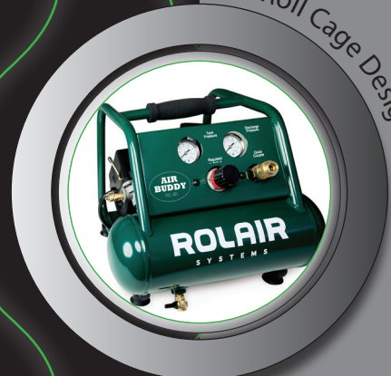
Roll Cage Design