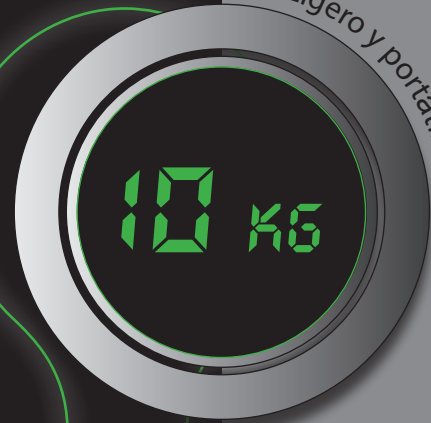
Ligero y portátil!