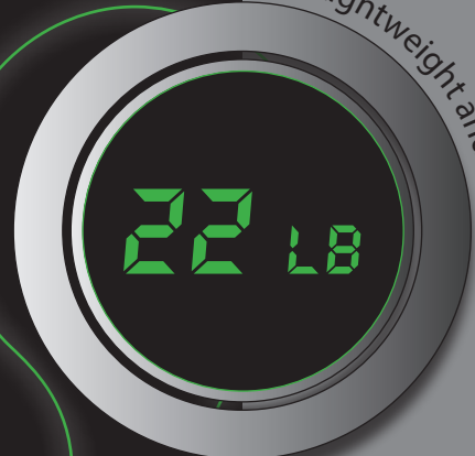
Lightweight and Portable